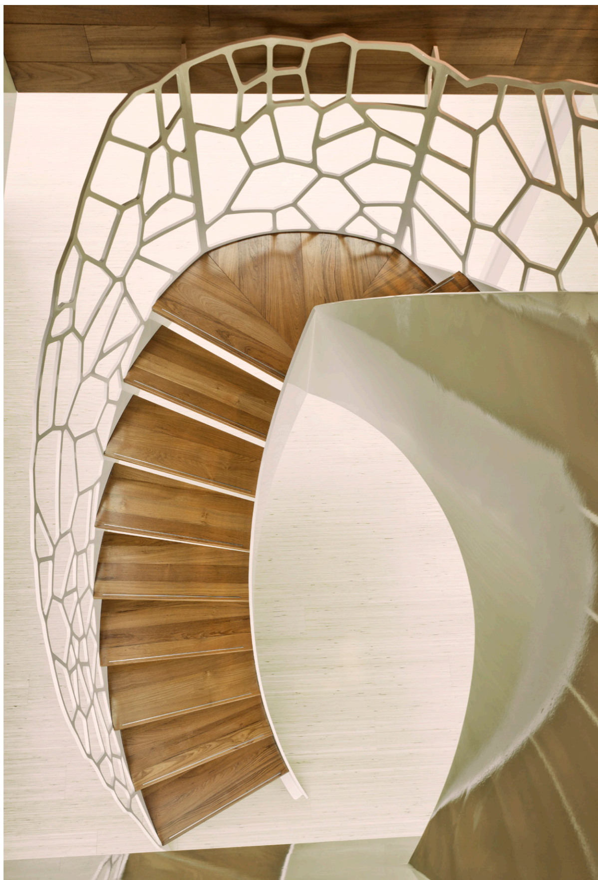
Cells™ by EeStairs